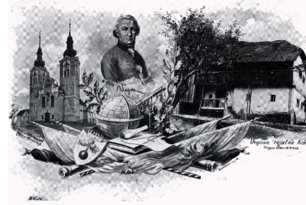
Motiv z razglednice