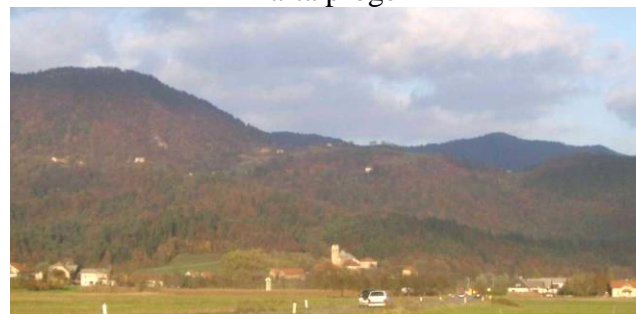
Pogled s Kleškega polja