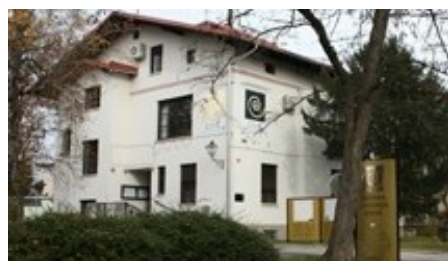
Ljudska univerza Kranj