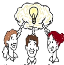
Skupaj iščemo rešitve